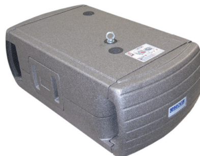
Drehschieber-Pumpe in Schallhaube SH19/SH20