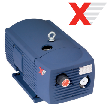
Drehschieber-Vakuumpumpe VX 4.25 der X-Serie