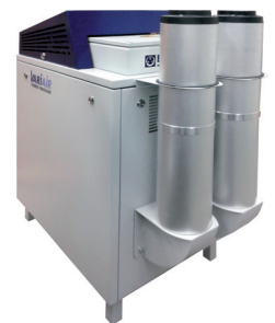
VATP 1600 incl. extra geluiddempers