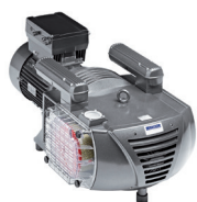
Lamel pumpe tørtløbende (oliefri)