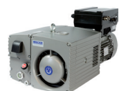
Lamel vakuumpumpe oliesmurte