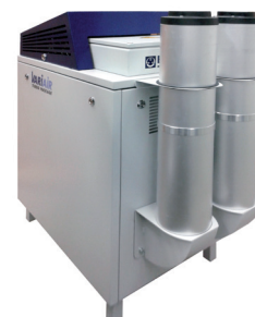
VATP 1600 inclusi i silenziosi aggiuntivi

T +39 051 6063811 F +39 051 6053168 becker@becker.it www.becker-international.com